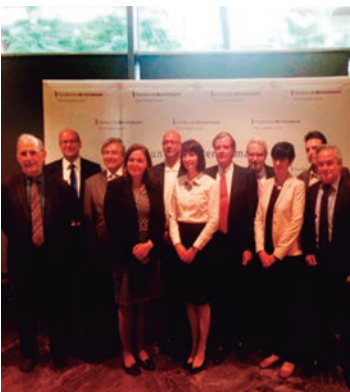
Foto d'alguns dels ponents de la jornada de la Fundació Bertelsmann