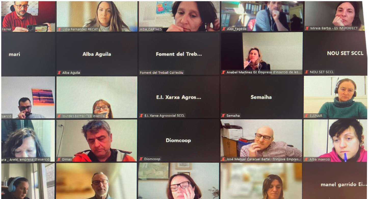
Reunió de socis "online"