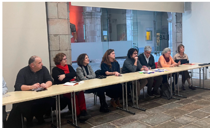
Grup de treball turisme cinematogràfic

FEICAT participa activament en la Junta Directiva de la Taula d'Entitats del Tercer Sector Social de Catalunya. Com hem informat altres vegades, en l'exercici d'aquestes funcions, una de les activitats és la de representar a la Taula en el Consell Municipal de Turisme de Barcelona tant en les seves reunions ordinàries com en les sessions de treball monogràfiques temàtiques. Una d'aquestes va ser sobre Turisme Cinematogràfic i es va celebrar al Palau de la Virreina. L'objectiu és trobar altres vies de turisme amb menys impacte negatiu a la ciutat i més generadors d'ocupació i impuls a l'economia social.