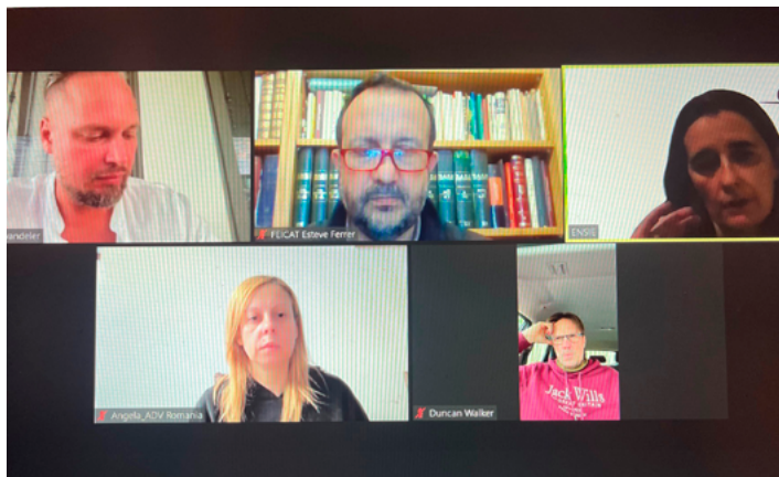
Reunió "online" del CE d'ENSIE

Les darreres decisions preses varen ser per a reforçar l'estructura d'ENSIE a través de projectes Europeus així com d'establir línies de solidaritat amb els companys d'Ucraïna.