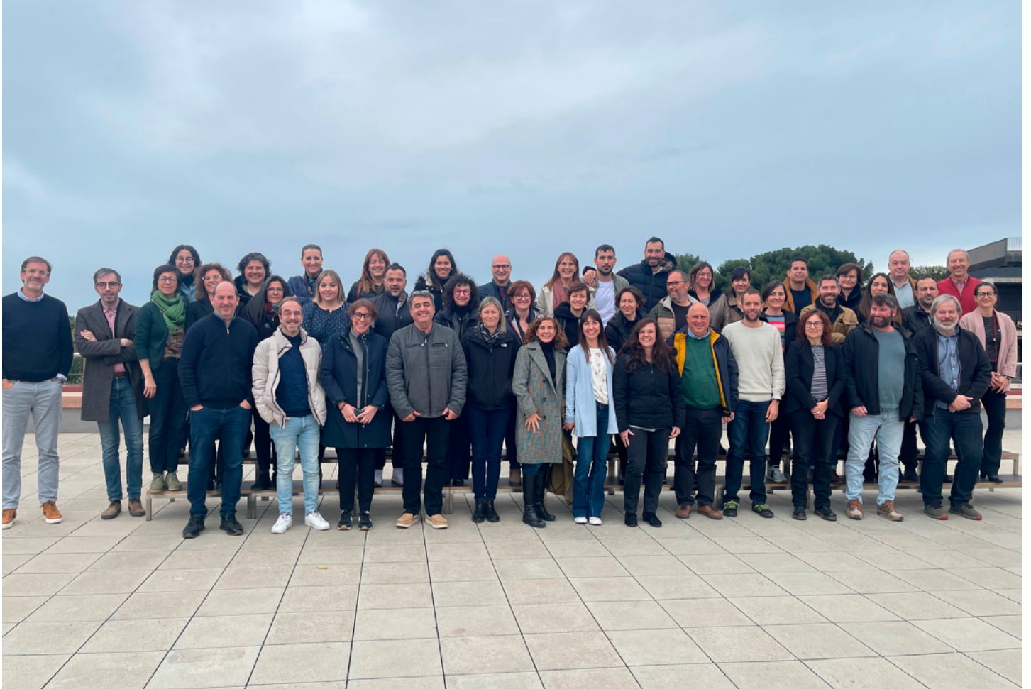
Tots els assistents i professors