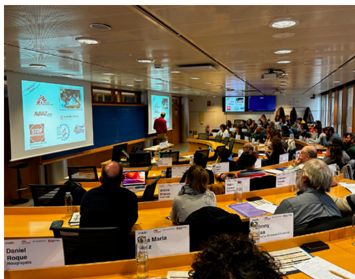
"Programa de Lideratge Social en Empreses d'Inserció" ESADE

No hi havia precedents d'una iniciativa similar. Calia treballar en dues direccions: aconseguir la flexibilitat de l'equip docent d'ESADE per a fer una adaptació del programa i aconseguir fonts de finançament extraordinàries per a assumir el cost elevat d'aquesta formació.