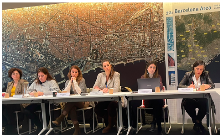
Taula Ocupació Inclusiva

Després de més d'un any sense convocar-se, el passat 2 de febrer es va celebrar una reunió de la Taula d'Ocupació Inclusiva dins de l'Acord de Ciutat per l'ocupació de qualitat 2021-2030. En aquesta Taula, FEICAT hi participa directa i activament. En aquesta reunió es va aprovar el pla de treball per enguany i es va acordar presentar l'informe de resultats de prioritització d'actuacions per a majors de 45 anys.